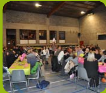
Après : la fête !