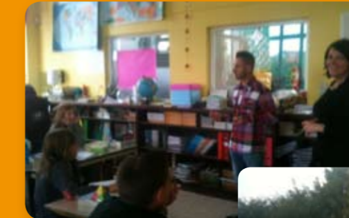
Les élèves de sixième année